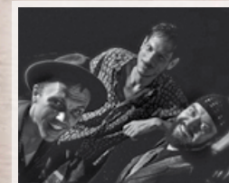
Sa 17.7. Mighty Orq (USA)