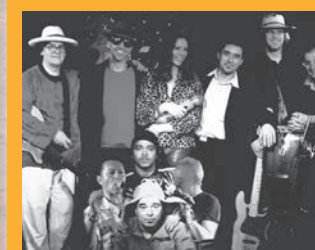
Sa 30.3. Iguanas