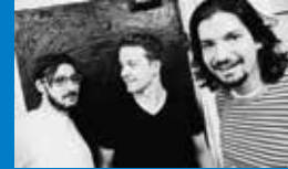
Sa 04.01. Organ Explosion