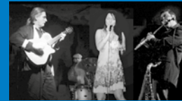
Fr 24.01. Abejas