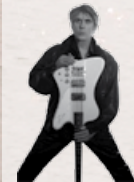
9.11. Wishbone Ash (GB)