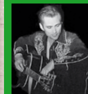
Sa 25.8. James Intveld & Band (USA)