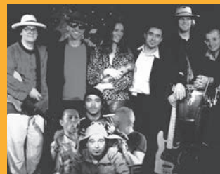
Sa 30.3. Iguanas